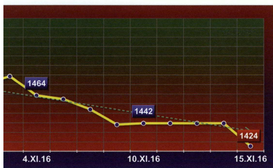
ZMIANA WARTOŚCI AKCJI FIRM WCHODZĄCYCH DO INDEKSU GIE W OKRESIE OD 17 PAŹDZIERNIKA 2016 r. DO 15 LISTOPADA 2016 r.